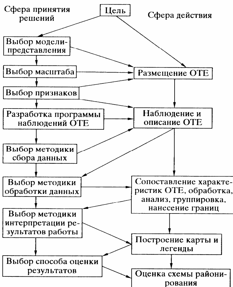
Схема процесса районирования [1423]

Т.П. Куприянова [1423, 1424] под районированием понимает двуединый процесс: с одной стороны, это принятие последовательных решений, а с другой – многократный отбор, «просеивание» сведений об объекте для получения искомого результата (схема). Обе составляющие тесно связаны между собой и испытывают влияние объективных факторов районирования. Левая и правая колонки элементов на этой схеме соответствуют творческой и стандартной частям работы. К творческим задачам можно отнести поиск, выбор и обоснование конкретных действий. Действия, отраженные в правой части, можно в значительной степени формализовать, стандартизировать, представить в виде алгоритмов, выполнение которых можно поручить ЭВМ. Эти действия основаны на принципах формальной логики, теории планирования эксперимента, автоматического сбора и обработки информации.